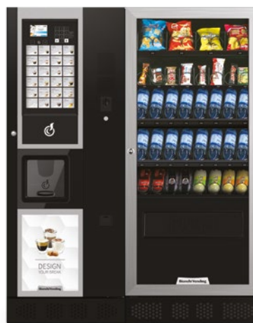
LEI400 SMART + ARIA M SLAVE

ARIA M, distributeur automatique réfrigéré à 3° pour la vente de produits snacks, sandwiches, produits frais, boîtes et bouteilles.