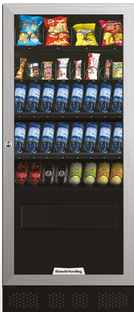
ARIA M SLAVE