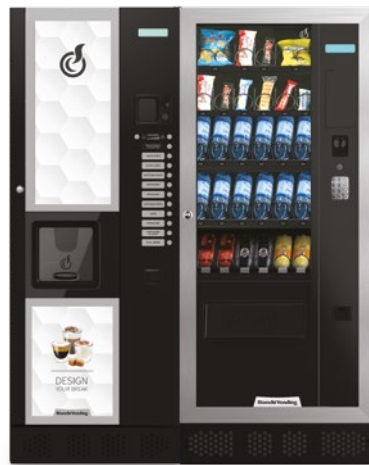
LEI400 + ARIA M MASTER