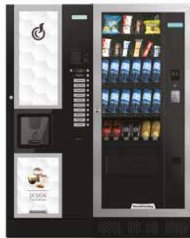
LEI400 + ARIA M MASTER

LEI 400, distributeur automatique 400 gobelets pour boissons chaudes.